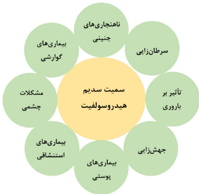
شکل ۲. اثرات منفی بلانکیت بر سلامت مصرف‌کنندگان [۲۶]