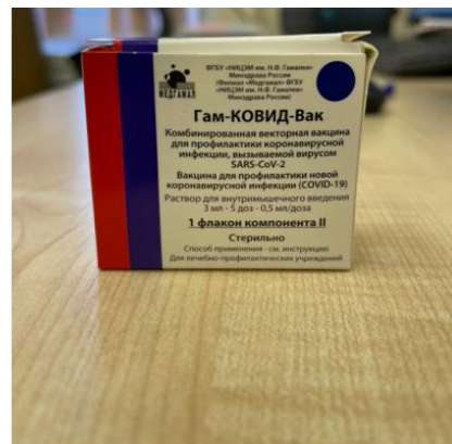
Component II (secondary packaging)

Paper box containing 5-dose vial for 3 ml