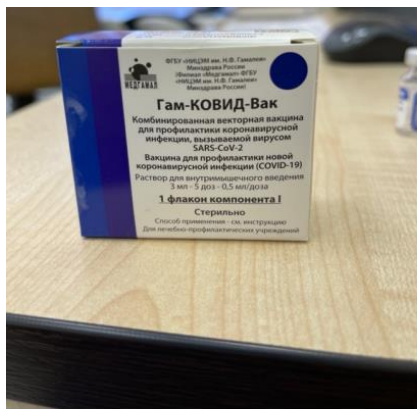
Component I (secondary packaging)

Paper box containing 5-dose vial for 3 ml